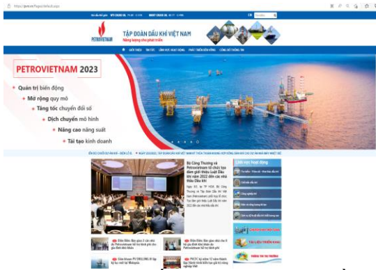
Webiste chính thống của Tập đoàn Dầu khí Việt Nam sử dụng tên miền quốc gia “.vn” (pvn.vn)